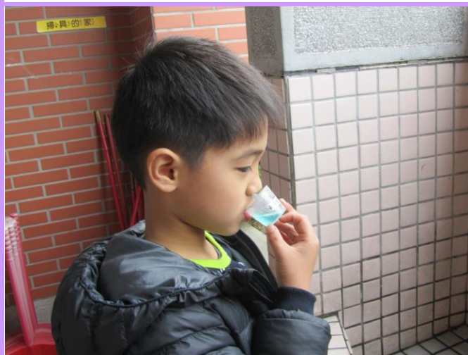
餐後用專屬小牙杯含氟在口中漱漱口