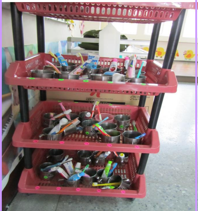
班級牙刷用具擺放整齊