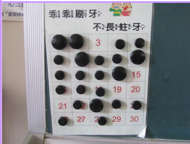
教室黑板設置潔牙完成登錄表格