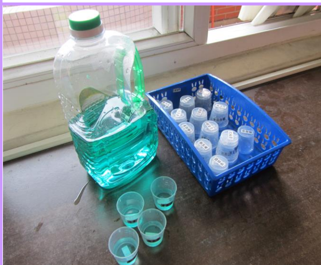
每天含氟漱口對牙齒多一層保護