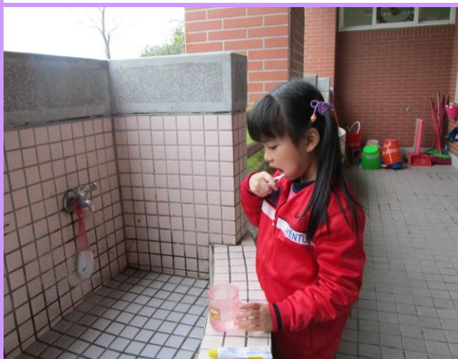
同學陸續餐後進行潔牙注重牙齒衛生