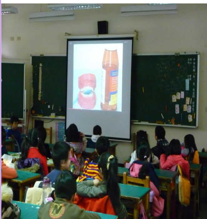
導師播放影片教導正確的刷牙方式