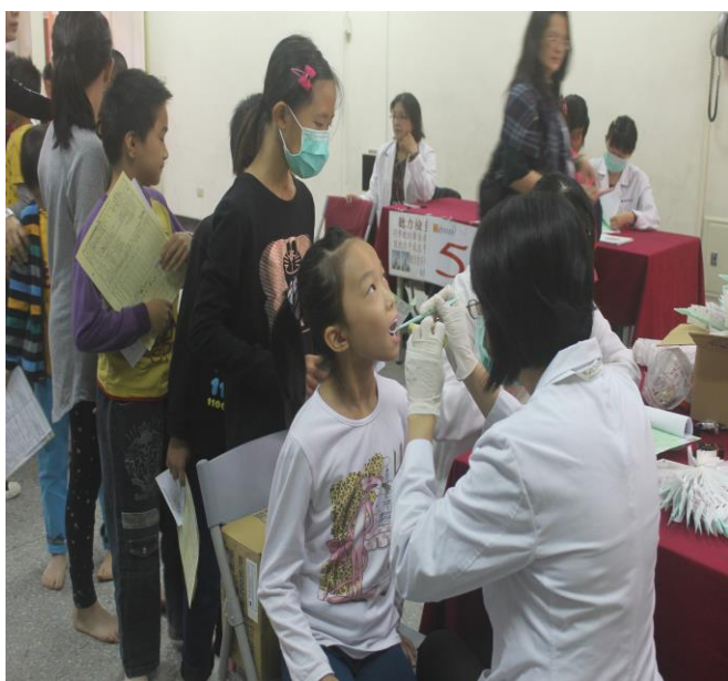
學生健康檢查由牙醫師仔細檢查