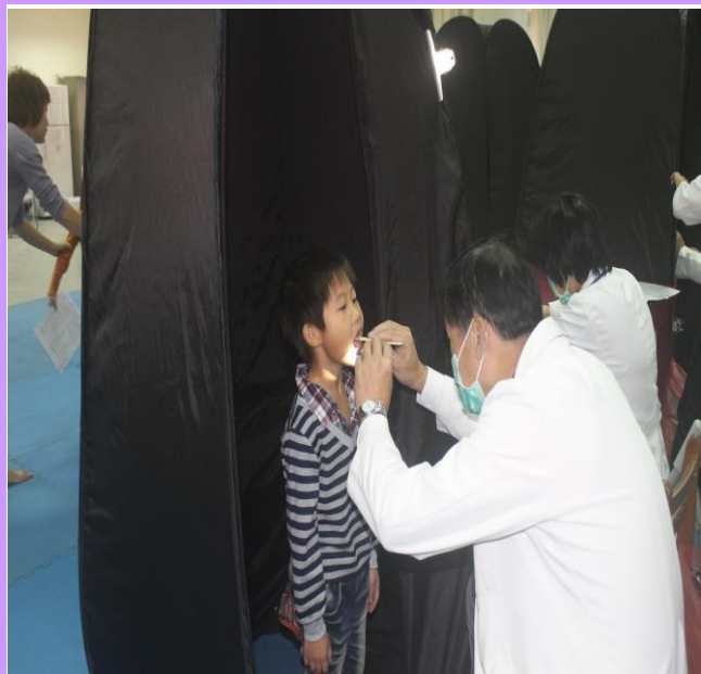
張大嘴巴，檢查一下有沒有蛀牙